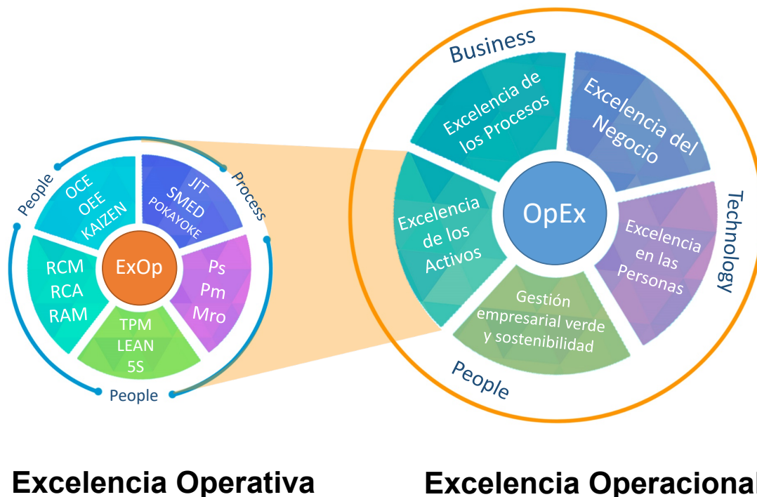
Figura 1. Modelo de Integración Excelencia Operativa Vs Excelencia Operacional, Amendola.L, 2010, 2020

Desarrollar capacidades, competencias, para pensar mejor, críticamente y asociativamente, en la organización es importante para implementar exitosamente un programa de Excelencia Operacional. Recordemos que toda planificación implica pensamiento, y a partir de ahí se desarrolla la acción, que implica un trabajo simultáneo del equipo humano en todas y cada una de las áreas funcionales-operativas de la organización , apoyando mediante la aplicación de excelencia de los procesos, excelencia del negocio, excelencia en las personas, excelencia de los activos y gestión empresarial verde y sostenibilidad (Amendola. L, 2010).